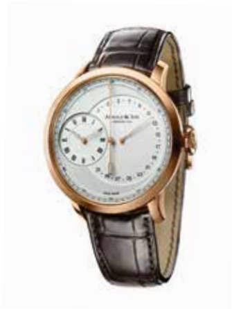
ARNOLD & SON

Herrenuhr «TBR True Beat Retrograde» in Rotgold 750 auf Lederband; automatisches Manufakturwerk mit springender Sekunde und retrogradem Datum.