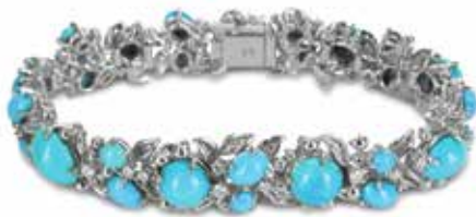
MEISTER 1881 COLLECTION

Armband mit 27 Türkis-Cabochons 34,32 Karat und 45 Brillanten 1,74 Karat in Weissgold 750.